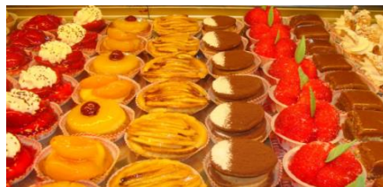
Exemple de denrées emballées sur le lieu de vente à la demande du consommateur