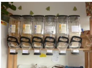
Exemples de denrées non préemballées sur le lieu de vente

Pour ces produits, la déclaration nutritionnelle est facultative Si votre produit ne répond à aucun de ces critères, il est considéré comme pré-emballé , la déclaration nutritionnelle sera donc obligatoire