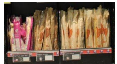
Exemples de denrées préemballées en vue de leur vente immédiate